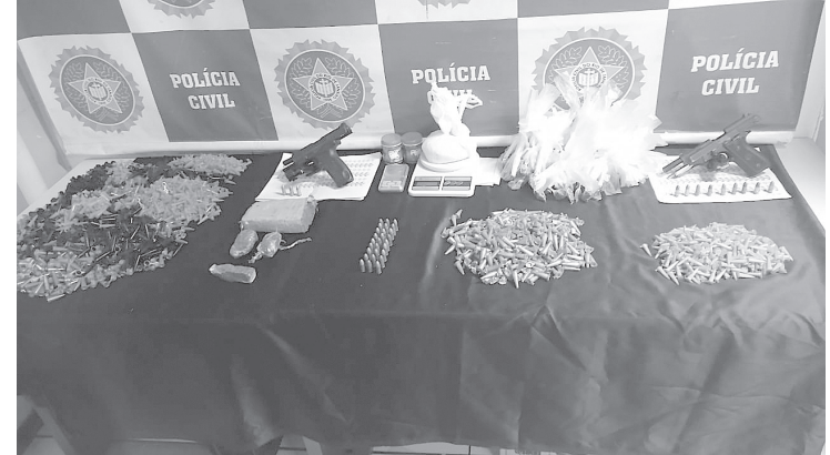
Na ação foram apreendidos pinos de cocaína, tabletes de maconha, duas pistolas e milhares de pinos plásticos vazios

Com o menor foi encontrada certa quantidade de