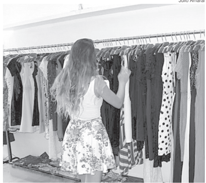
O setor de serviços é responsável por 30% dos postos de trabalho abertos no quadrimestre

donda ficará na antiga loja do Ponto Frio, próximo à Avenida Amaral Peixoto, no Centro. As obras da nova sede já estão na reta final.