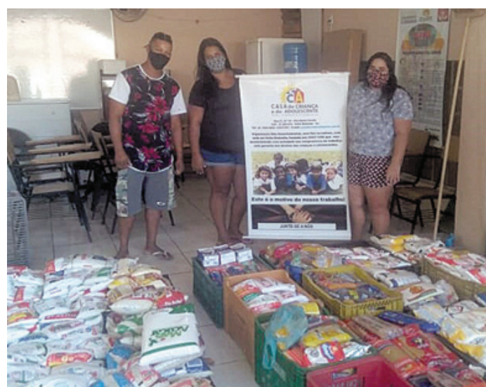
Integrantes da Casa da Criança e do Adolescente de Volta Redonda, recebendo a doação de 1 tonelada de alimentos, através da iniciativa da Corinto Center Park