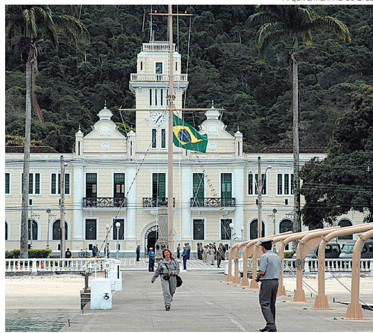
Diferentemente do Colégio Naval, os Colégios Militares (ligados ao Exército Brasileiro) sempre aceitaram mulheres