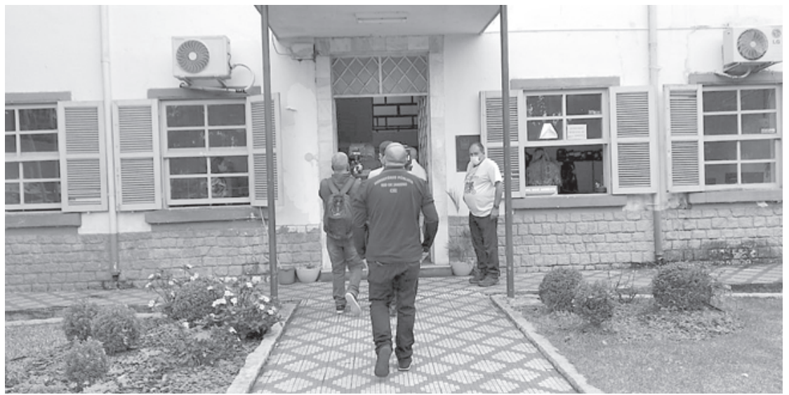
Agentes do grupo de apoio ao MP (Gaeco) quando chegavam nesta terça à Prefeitura de Itatiaia

Após a deflagração da fase I da Operação Apanthropia, as investigações demonstraram que o prefeito interino, que assumiu o cargo após o prefeito eleito, Eduardo Guedes, ter sua