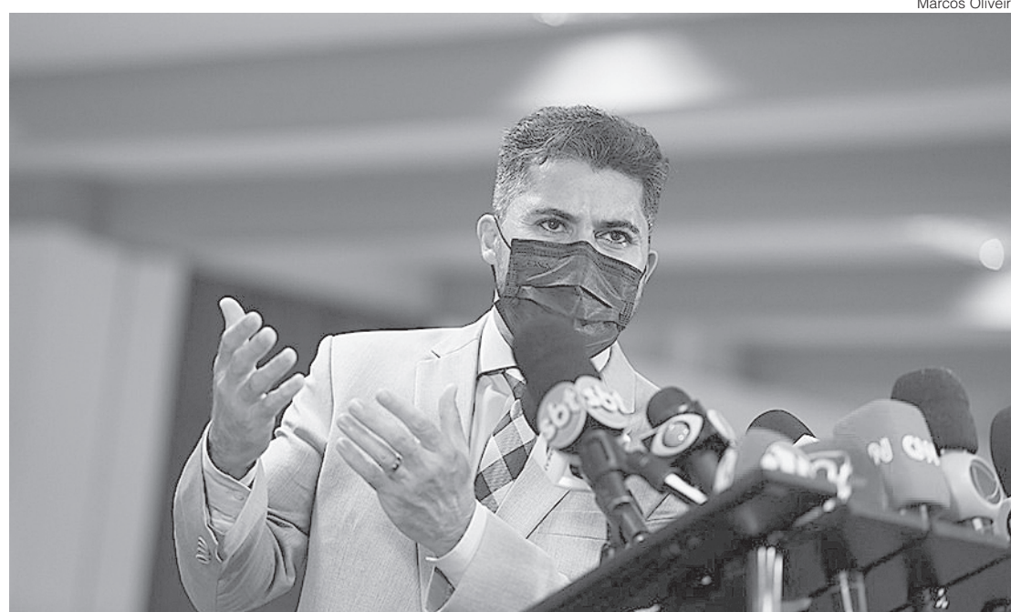
O senador Marcos Rogério (DEM-RO) deu entrevista após a reunião da CPI da Pandemia, que durou mais de 8 horas